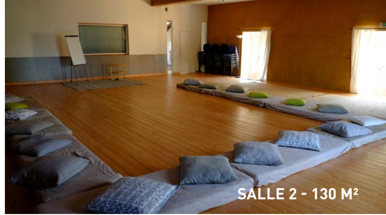
SALLE 2 - 130 M 2

2 salles de travail 1 salle de restaurant Capacité de 80 personnes en conférence Jusqu'à 34 couchages en chambres Restauration de qualité