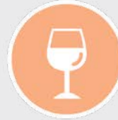
Cocktail / Banquet