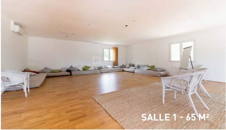
SALLE 1 - 65 M 2